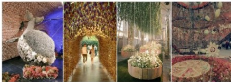
Foto uit de website van Fleuramour. Klik op de foto om de website te bezoeken.